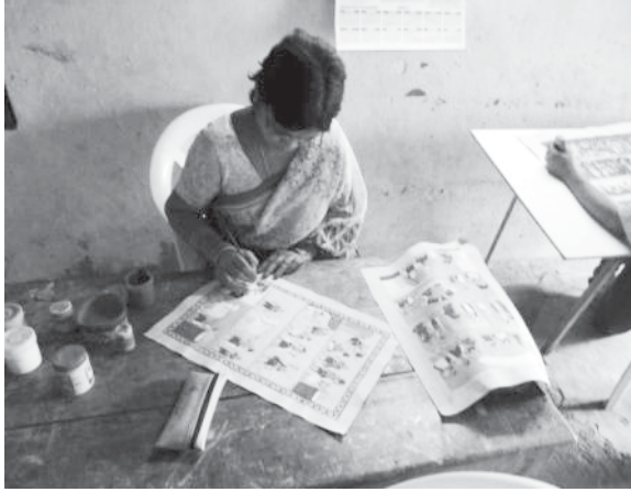
తెలంగాణ చిత్రకళకు పునాది వేసిన చెర్యాల చిత్రకళను తరాల నుంచి

Cheryal Vanajakka : The Vibrant colourful works of Cheryala Painters reflect the cultural complexities of ordinary Telanganites. Their technical skills and creative reflections on the canvas, the greater intensity in the organic metaphors, the rural wisdom in their perceptions and the local visions in their thematic frames show the cultural values and ethos that shape the unique aesthetic ideas of Telagana Region.